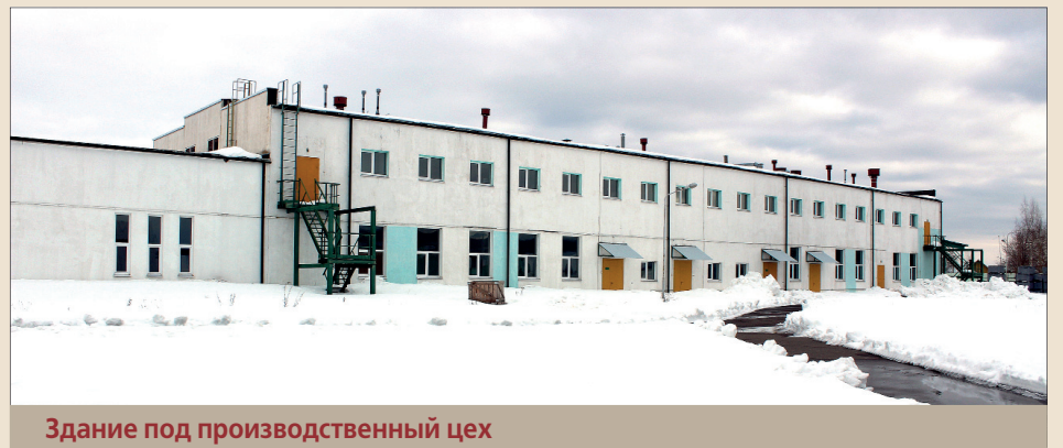
Здание под производственный цех

Ввод в эксплуатацию новой могульной линии ожидается во второй половине 2019 года.