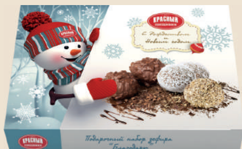
Подарочный набор зефира «Благодарю» 365 г.