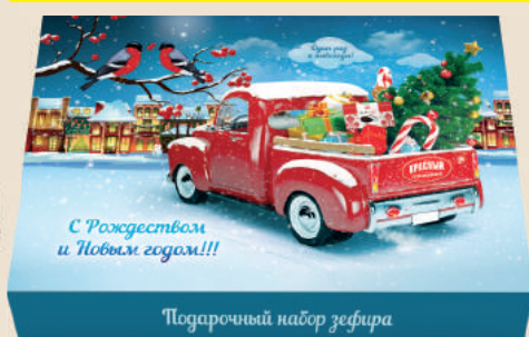
Подарочный набор зефира