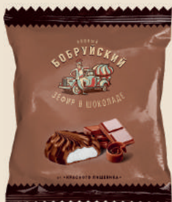
Зефир в шоколаде 32 г.