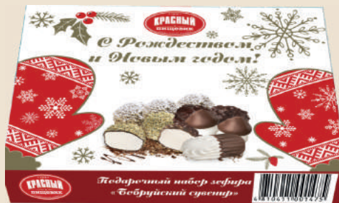
Подарочный набор зефира «Бобруйский сувенир» 650 г.

специально для вас есть большая круглая подарочная новогодняя упаковка, в которую может войти любое наше ассорти.