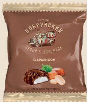
Зефир в шоколаде с арахисом 32 г.