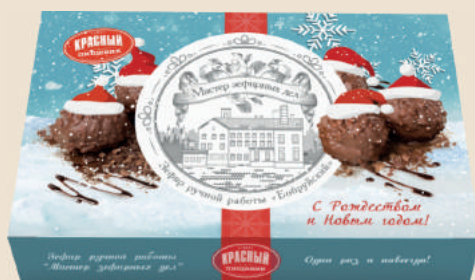
Подарочный набор «Бобруйский» ТМ «Мастер зефирных дел» 330 г.