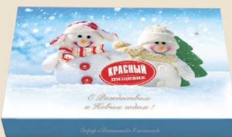
Подарочный набор. Зефир «ванильный» в шоколаде ТМ «Zefir.by» 250 г.